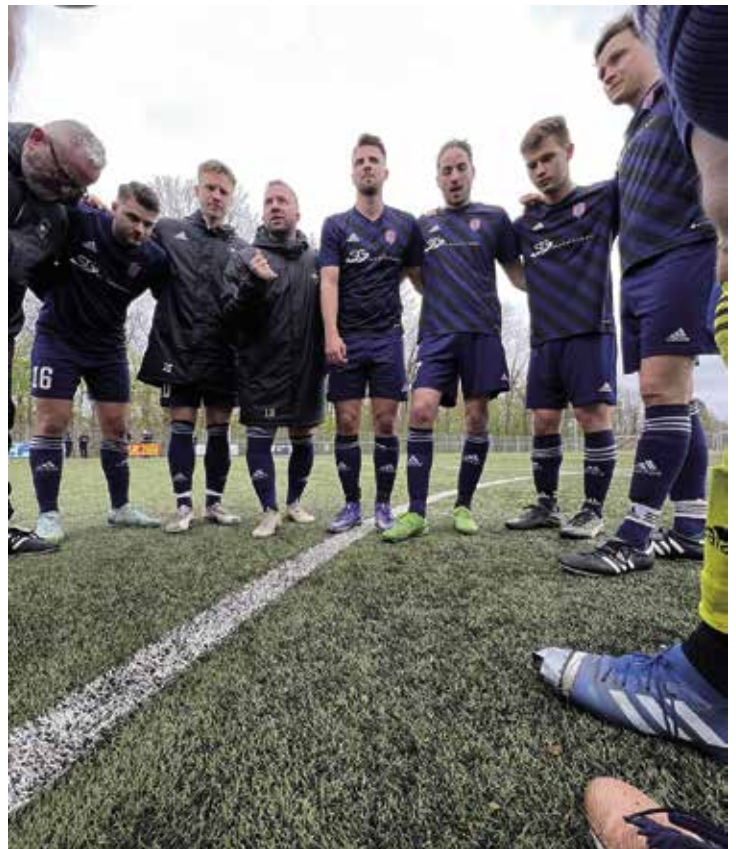
Spielerkreislauf unten. Übrigens: man beachte den blauen Fußballschuh rechts vorne. Wurde da mit Klebeband nachgeholfen. Vielleicht findet sich ein Spender für einen Ersatz?