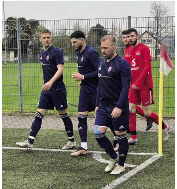
Nach der Halbzeit war das enge Spiel in Wimpfen beim Stand von 1:1 noch nicht gewonnen. Hoch konzentriert marschieren hier die SG Spieler zurück auf den Platz