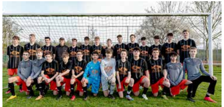
Die B-Junioren der SGM TSV Niederhofen/Oberes Leintal und die Jugendleitungen aus Niederhofen, Stetten, Kleingartach und Schwaigern bedanken sich recht herzlich für den neuen Trikotsatz beim Sponsor Firma Hoffer&Ryryrch GmbH Stahl- und Hallenbau aus Niederhofen.