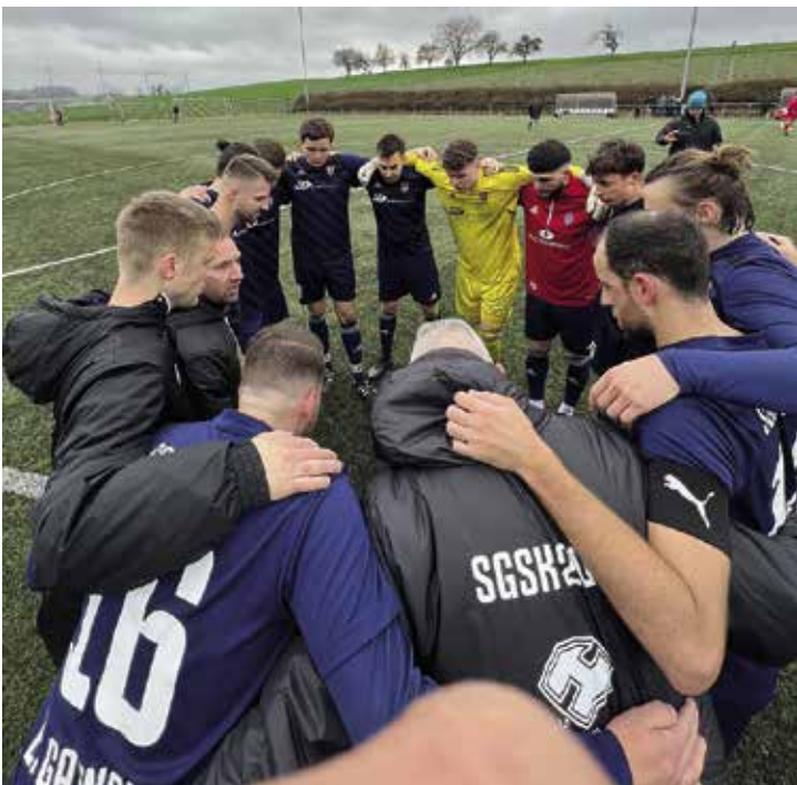
Spielerkreis von oben nach dem gewonnenen Spiel in Bad Wimpfen